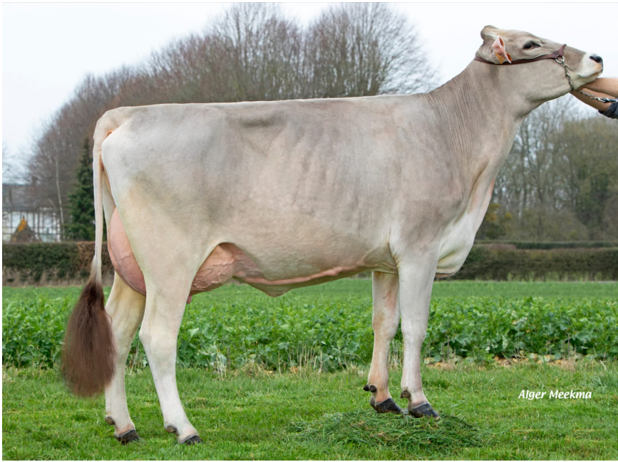
La Champronnière ODYSSEE B+ 84, ARRIÈRE GRAND-MÈRE DES PRODUITS À NAÎTRE