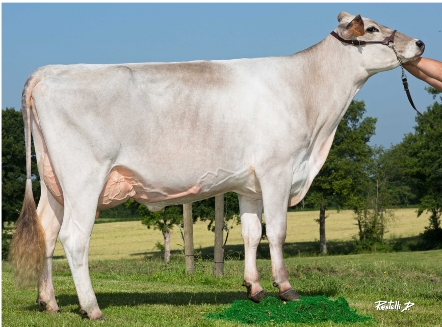
La Champronnière MAJESTE TB86, 4ème MÈRE DES PRODUITS À NAÎTRE