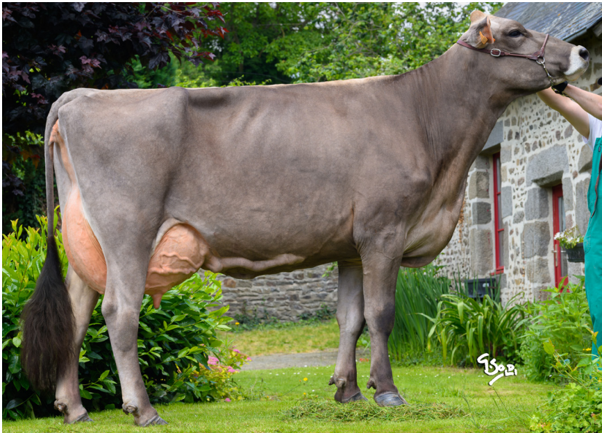
POGIRL TB88, MÈRE DE VEGAGIRL