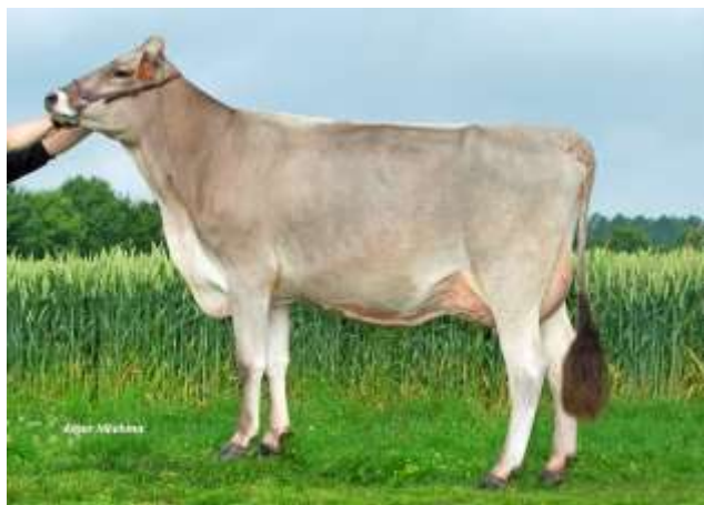
MUSOLDE (Fact) mère de PACTOLE