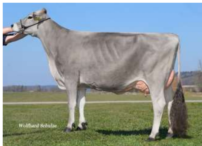
ISARIA (Vipro P), mère de Boxer P