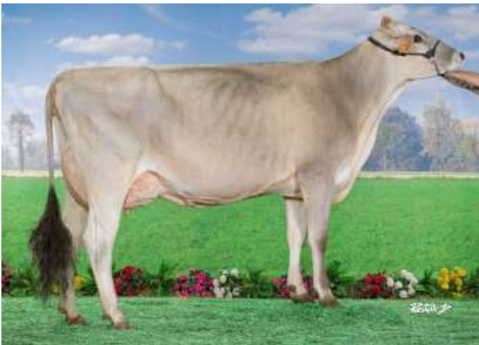
ORCHIDEE (Arrow) mère de TREFLE

Une fille de PHENIX sur une lignée de vaches à concours !