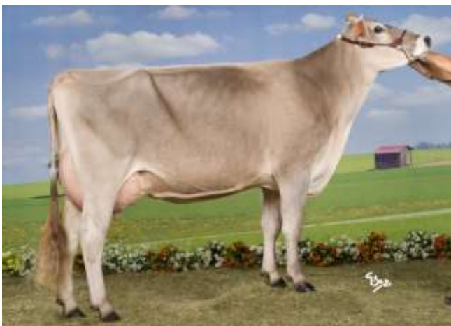
ECHALOTTE (Tau) même famille que OPTIMA