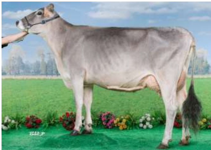
LOTERIE (Ifeling), grand-mère des embryons