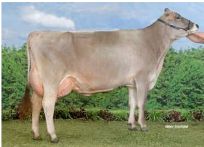
Best (Payoff) 5ème mère de TORNADE et fille de REINE

Une descendante de la très célèbre Denmark REINE EX 93 :