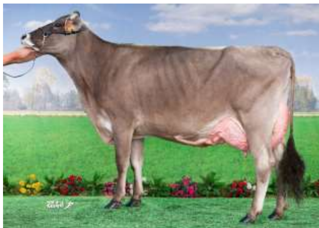
JOUVENCE (Greenwich) 3ème mère de SAUVAGE

Une génisse pleine sur une famille morpho !