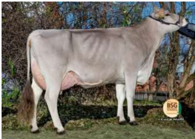
LAMOUR une fille de IFEELING

Une primipare en début de lactation pour concourir au National !