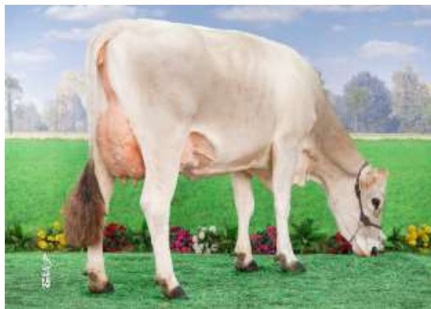
LIQUEUR (Hercules) mère de TARTE

La famille de SNOOPY, nouveauté BGS à 204 d'ISU est à portée de main !