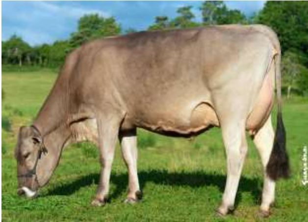
NESS (Jaguar CH, mère de PISTON)

Un coup de PISTON sur une souche au profil lait, taux, morpho !