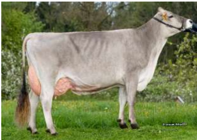
VOBIS mère de Veles P

Une génisse sans corne sur une souche à 100 000 kg de lait !