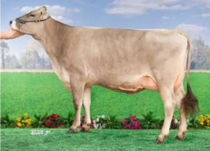
MAJESTE (Jeroboam), mère de ULTRABELLE

Une belle génisse sur une famille de vache de show !