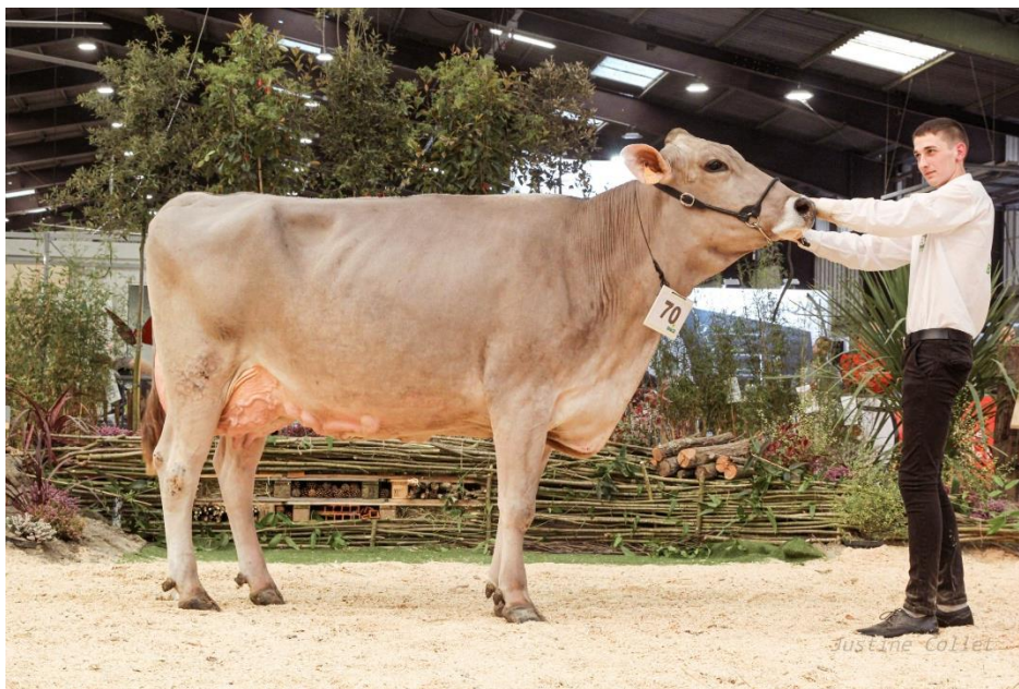
Blooming NATINE grande championne brune ouest 2022, petite-fille d'EGLANTINE et cousine de TRIPOLI