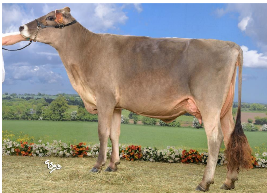
SAGESSE, fille d'Oxygene