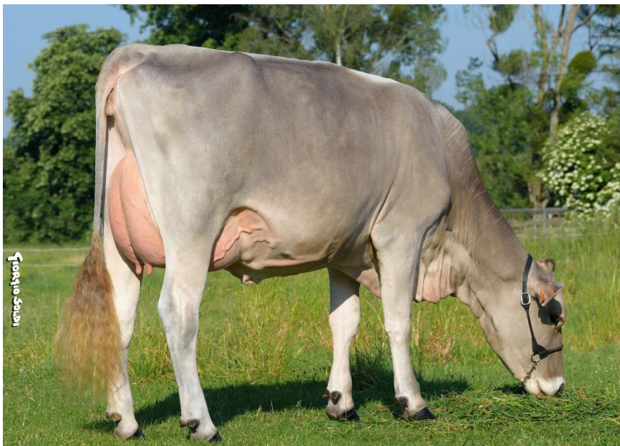
DLS NOUMEA, fille d'OPTIMAL