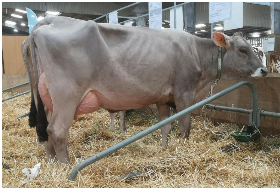
Landsaro Olympic RAVENNE, mère de TESS