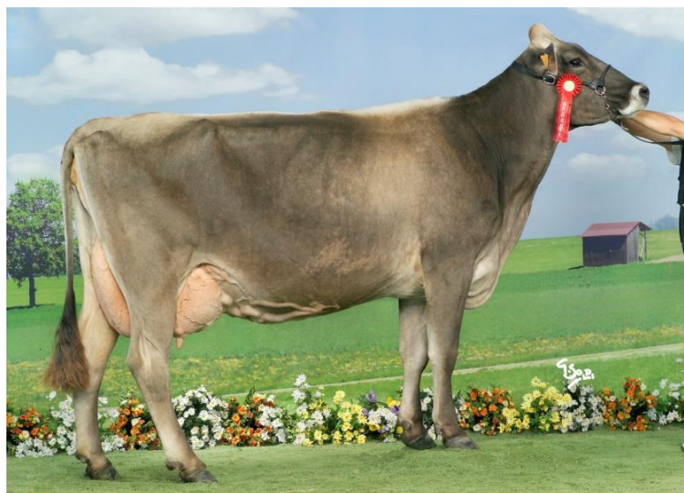
Février REGLISSE EX 91 au concours national en 2006