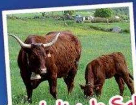
Présentation de Salers