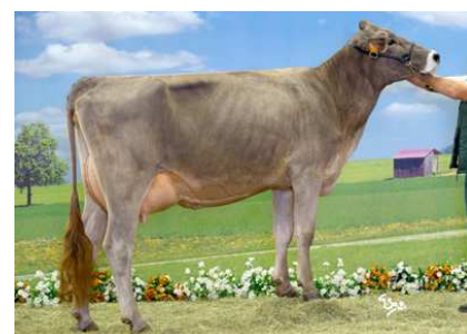
Colombe, fille de Vulcain au Gaec de Boussac (15)

Chez les taureaux au catalogue depuis plusieurs saisons, la stabilité est aussi bonne. TRACTION, le taureau le plus utilisé la saison passée, se maintient très bien à 137 en ISU. SAGITTAIRE et TALC perdent 3 pts d'ISU chacun avec une légère érosion de leur index lait, restant à un niveau très élevé (1598 et 1383). Quant à UCHAYR il ne bouge que d'un point d'ISU.