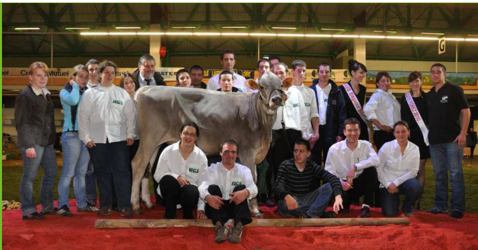
Toute l'équipe Brune à St Etienne autour d'Energy

DALLY est tout à fait stable, ainsi que JOEL